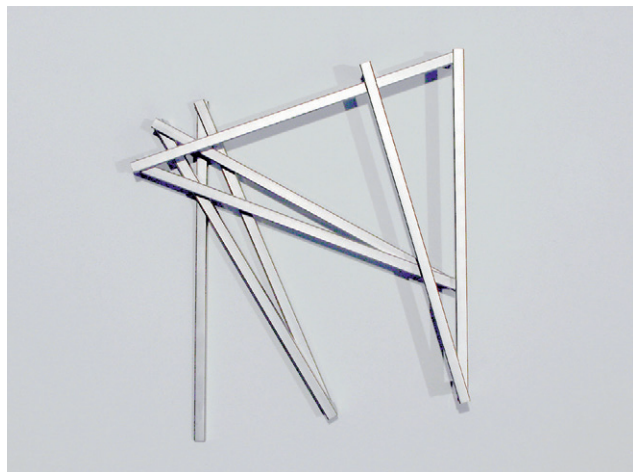
Pinox n° 1, 1 = 10°, n: 3.141592, 7 Winkel, 2002 © François Morellet

Die Wahl der Materialien, anhand derer ich diese geometrischen und von der Definition her immateriellen Linien konkretisierte, ersetzte die Launen meiner Hand. So habe ich auf der Fläche Bleistiftstriche, Reißfedern oder Pinsel, Klebestreifen, Gitterzäune, Zweige, Neon-